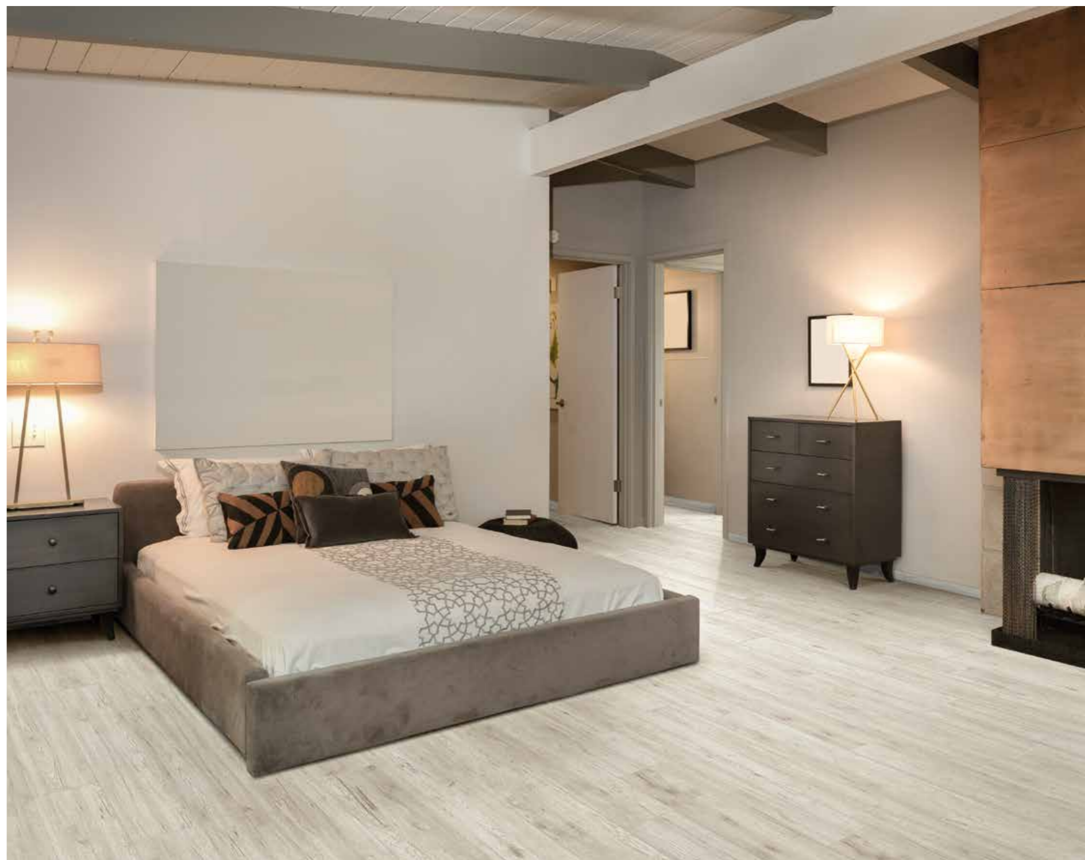
SIERRA GRIGIO 20x122