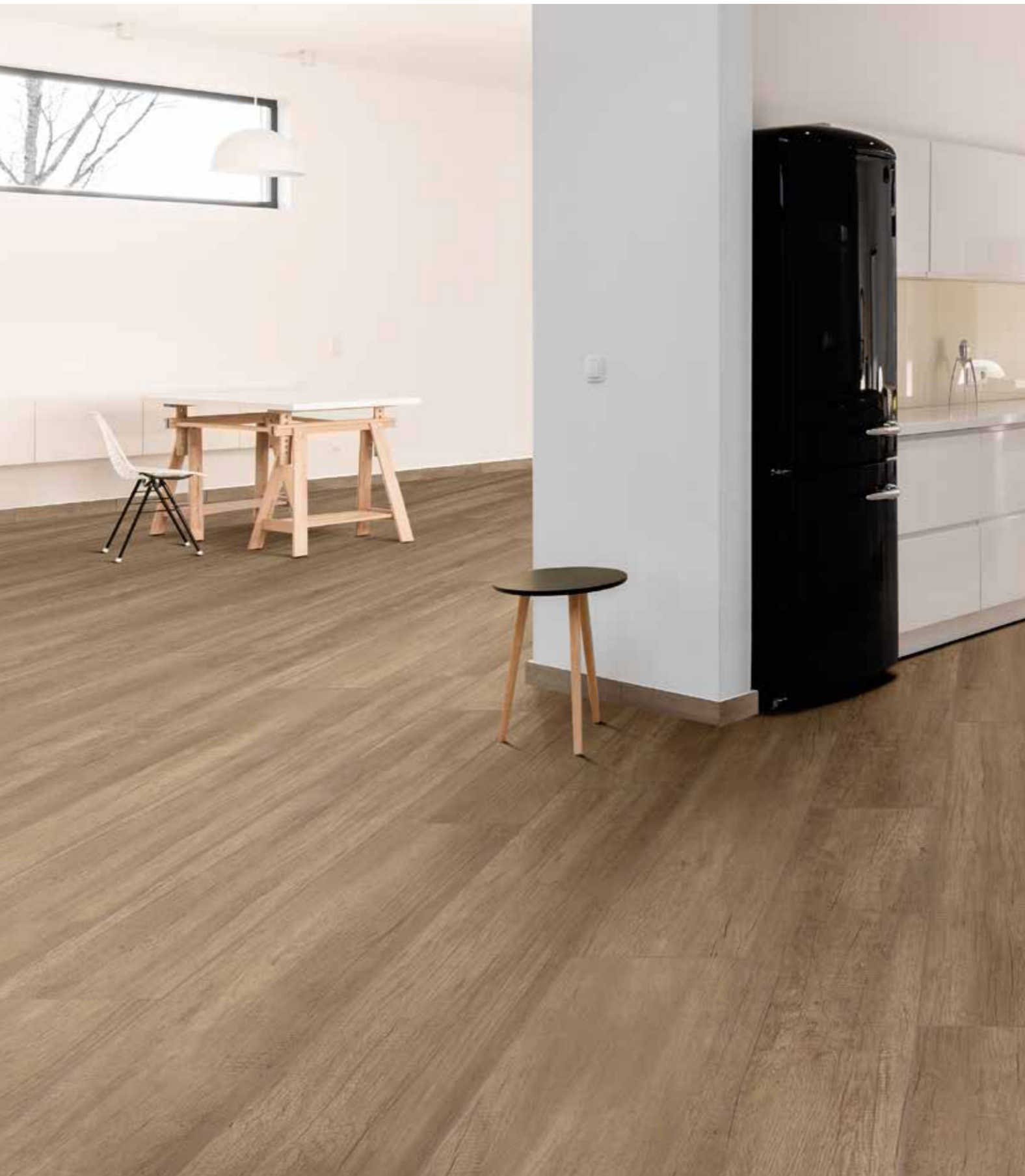
SIERRA BEIGE 20x122